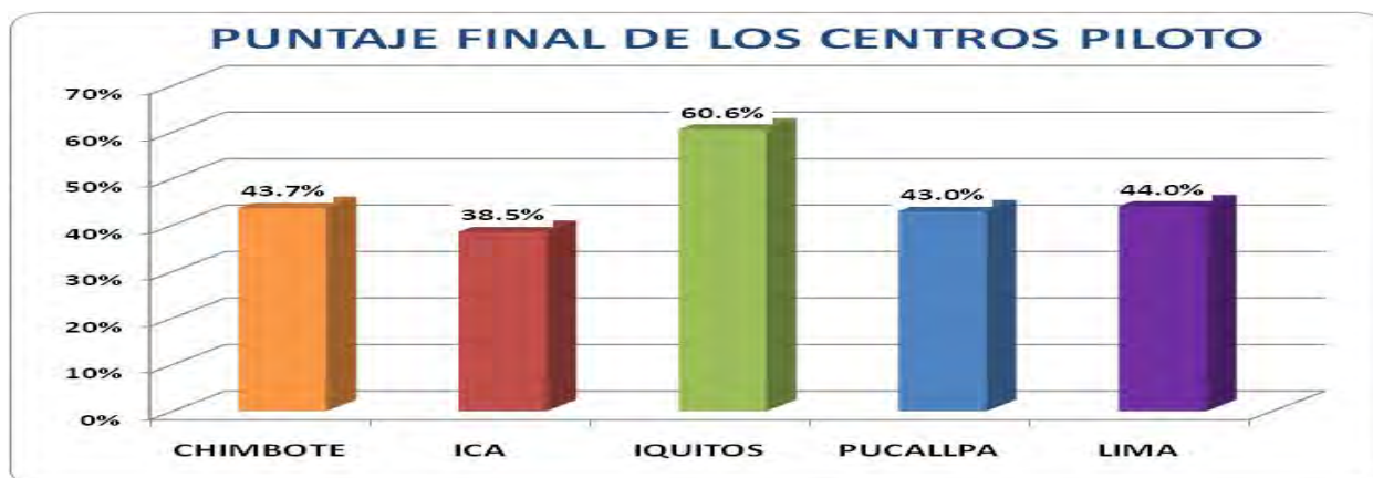
Grafico n° 1 Puntaje alcanzado por los centros pilotos de atención Integral a las FVVS

Como puede verse en el grafico 1 ninguno de los establecimientos evaluados llega al puntaje de acreditación. Y solo el Hospital Regional de Loreto supera el 50% del puntaje total.