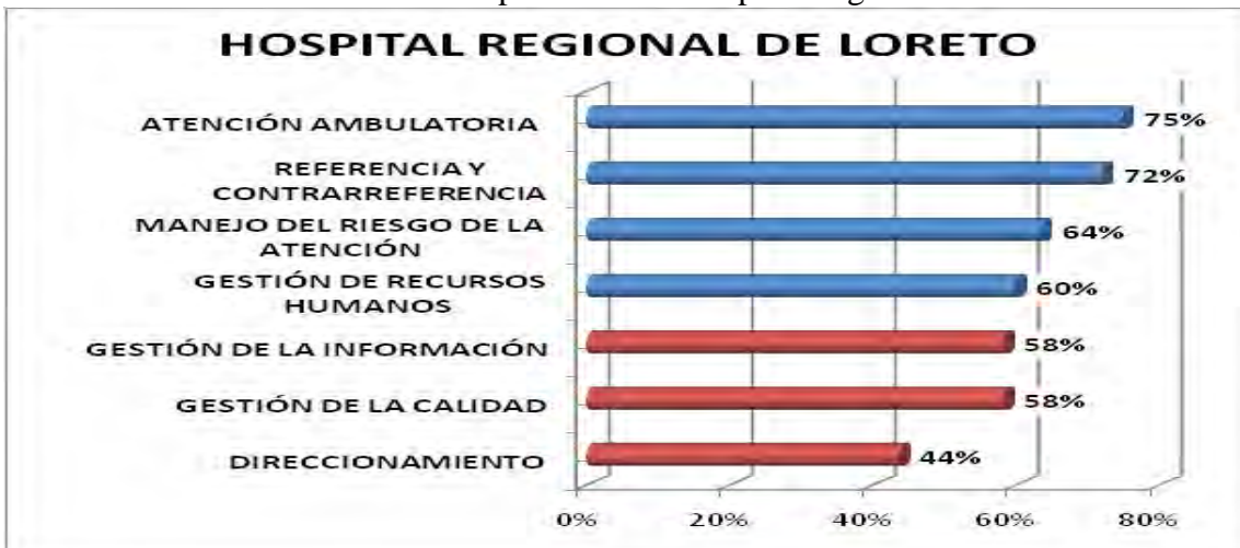
Grafico N° 5 Evaluación de macro procesos del Hospital Regional de Loreto

El macro proceso que peor resultado se ha presentado en este hospital es el de direccionamiento en el que alcanza un puntaje de 44% del total esperado. El reto que queda pendiente es pues el de poder incluir en todos y cada uno de los documentos de gestión la estructura y el concepto de la atención integral de familias viviendo con VIH/SIDA de y El porcentaje alcanzado esta dado por que la mayoría de los macro proceso solo aprobaron Puesto que como en los caso anteriores atención ambulatoria alcanzando apenas un 25% del promedio esperado. Grafico 4