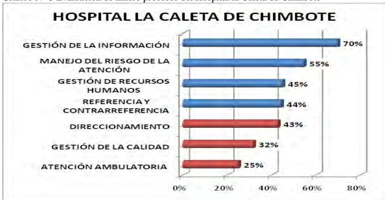
Grafico N° 3 Evaluación de macro procesos del Hospital la Caleta de Chimbote

El macro proceso que peor resultado ha presentado este Hospital es el de atención ambulatoria alcanzando apenas un 25% del promedio esperado, donde evidencia la presencia de guías de práctica clínica pero que no está garantizada su aplicación en la práctica médica diaria. Adicionalmente no se encuentran flujo gramas de atención ni se garantiza un espacio para la queja y sugerencia.