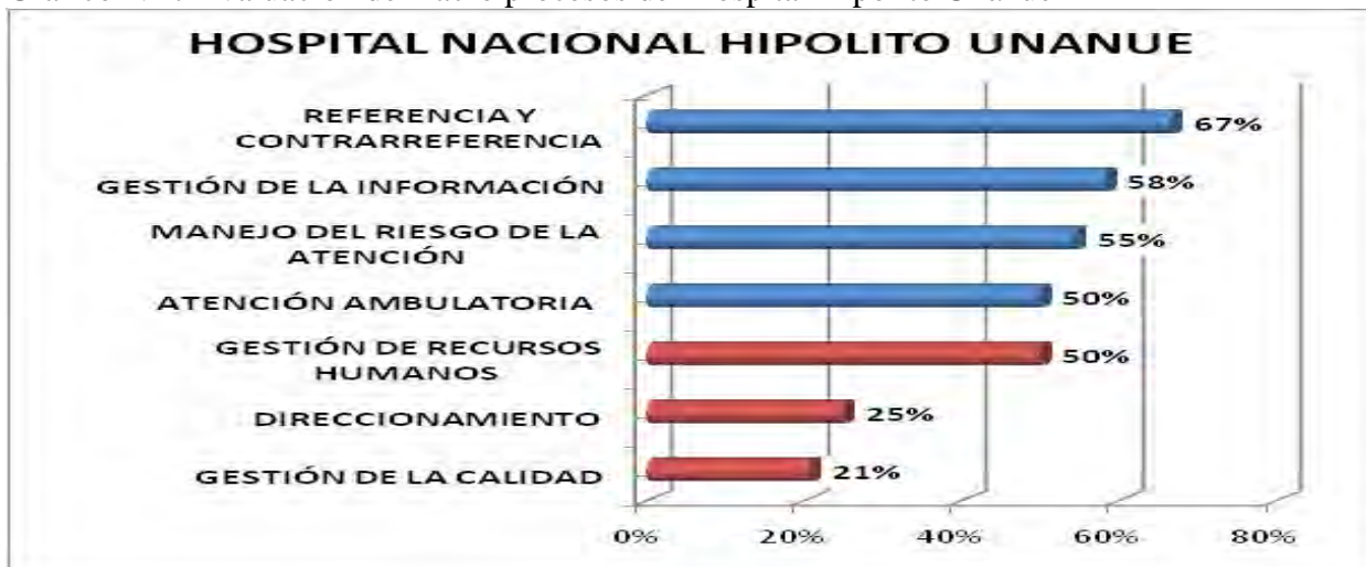
Grafico N° 7 Evaluación de macro procesos del Hospital Hipólito Unánue