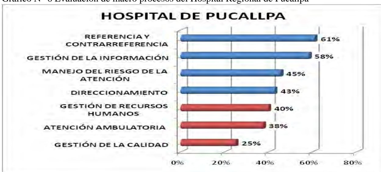
Grafico N° 6 Evaluación de macro procesos del Hospital Regional de Pucallpa

Es interesante observar que tanto el hospital de Pucallpa como el Hospital Hipólito Unanue tienen un mayor desarrollo del macro proceso de referencia y contra referencia. En ambos casos solo les falta documentar el proceso de referencias y contra referencias que realiza/recibe de acuerdo a la normatividad vigente y establecer un mecanismo de seguimiento de pacientes referidos las 24 horas, en caso no se haya producido la contra referencia efectiva. Gráficos 6 y 7 En ambos casos también el macro proceso con menos desarrollo, tanto para el Hospital de Pucallpa como para el Hospital Hipólito Unanue es el de Gestión de la calidad. El reto es incorporar en los planes institucionales de mejora de la calidad los pilotos de atención integral de las familias viviendo con VIH/SIDA