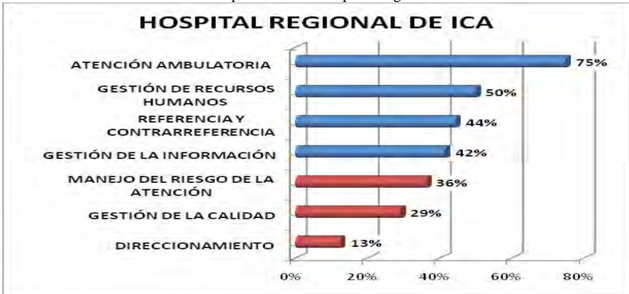
Grafico N° 4 Evaluación de macro procesos del Hospital Regional de Ica